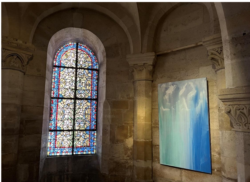
L'exposition Voix des lumières d'Anne Slacik dans la crypte de la basilique cathédrale Saint-Denis.

Dans la crypte de la basilique, Anne Slacik entreprend de capter et de traduire le rayonnement spirituel du lieu. Son travail s'inscrit dans l'héritage de la pensée de Suger, inspirée par les écrits du Pseudo-Denys : la lumière y est envisagée comme manifestation du divin, diffusée par l'architecture, les vitraux et la matière même de l'édifice. Cette lumière n'est pas seulement physique ; elle constitue un principe d'élévation, permettant par un mouvement anagogique de remonter du visible vers l'invisible, du sensible vers l'être sursensible.