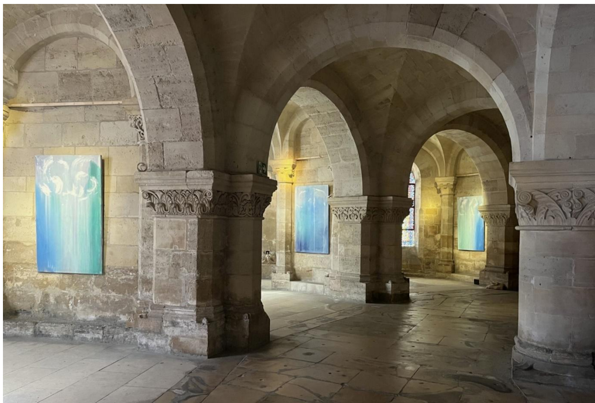
L'exposition Voix des lumières d'Anne Slacik dans la crypte de la basilique cathédrale Saint-Denis.