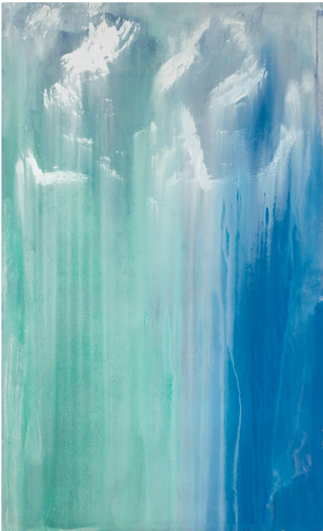
Lumière d'octobre huile et pigments sur toile 146x89 cm • 2025