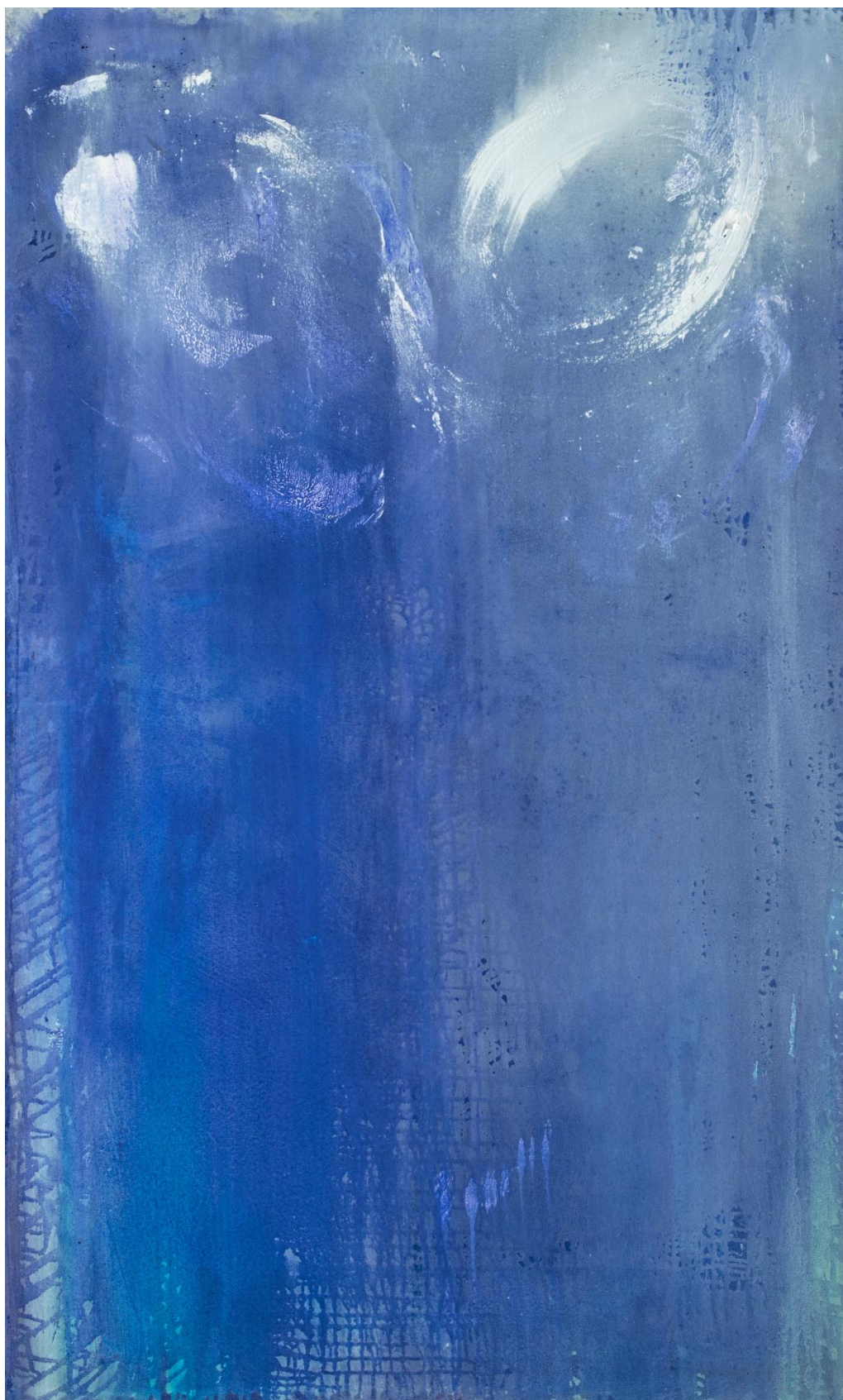
Voix des lumières (lumière d'octobre) • huile et pigments sur toile 146x89 cm • 2025