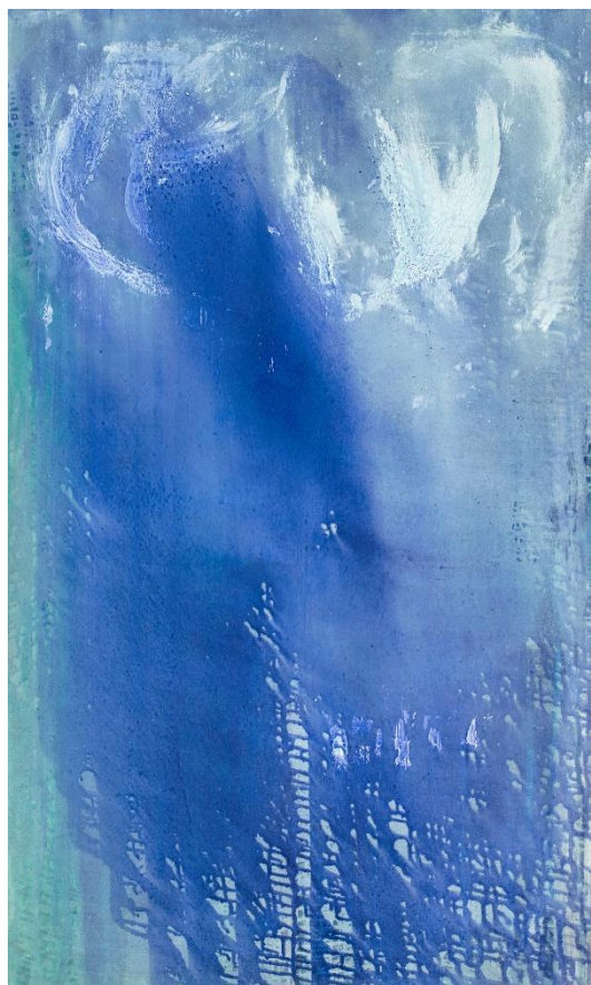
Voix des lumières (lumière d'août) • huile et pigments sur toile 146x89 cm • 2025

Les œuvres d'Anne Slacik reposent sur un travail subtil de la couleur, principalement autour des bleus et des verts. Ces teintes, historiquement valorisées au XIIe siècle, circulent librement sur la toile en glacis et en entrelacs. Le bleu, céleste et immatériel, évoque l'air,