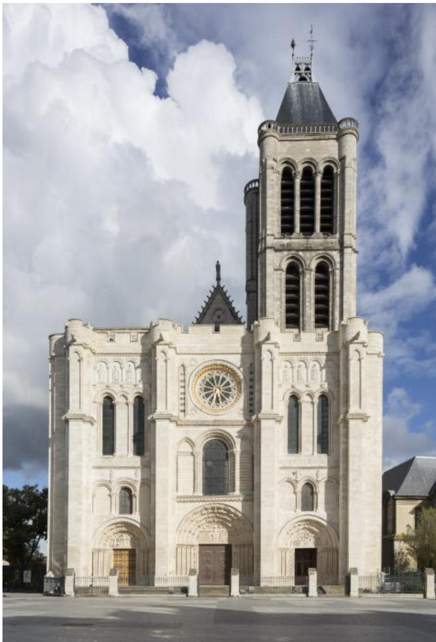
Basilique cathédrale de Saint-Denis, façade occidentale

Conçue par l'abbé Suger de 1135 à 1144, achevée au XIII e siècle sous le règne de Saint Louis, l'église inaugure la place centrale de la lumière, symbole du divin dans l'architecture religieuse gothique.